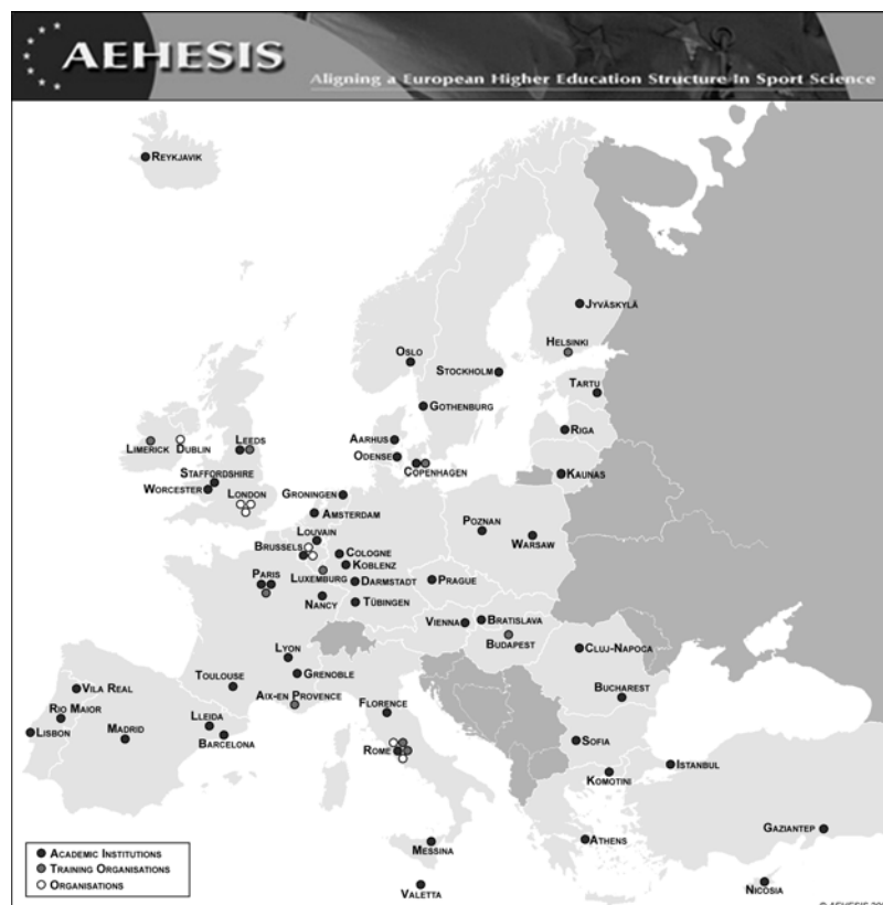
Kuvio 1. AEHESIS –projektin kumppaniorganisaatiot.

AEHESIS-projektin koordinaattorina on toiminut Euroopan liikuntatieteiden, koulutuksen ja työllistämisen organisaation (European Network of Sport Science, Education & Employment, ENSSEE) puolesta Kölnin Urheilukorkeakoulu (European Sport Development & Leisure Studies at the German Sport University Cologne). Projektin johtamiseksi perustettiin hallintoryhmä, asiantuntijaryhmä sekä neljä edellä mainituilla liikuntakasvatuksen avainalueilla (liikuntakasvatus, terveys ja kunto, liikuntahallinto sekä valmennus) toimivaa tutkimusryhmää.