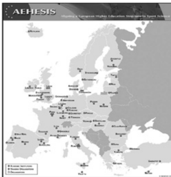
Figure 1: Organismes associés AEHESIS

Le projet a été coordonné par l'institut Européen d'études du développement et des loisirs en matière de sport à l'Université du Sport de Cologne, en Allemagne, au nom du réseau européen des sciences, de l'éducation & de l'emploi (European Network of Sport Science, Education & Employment ENSSEE). Afin de mener à bien ce projet, il a été créé un groupe management, un groupe d'experts et quatre groupes de recherche dans les domaines identifiés comme clés de l'éducation sportive, à savoir les secteurs de l'éducation physique, du management du sport, de la santé et du fitness, de l'entraînement.