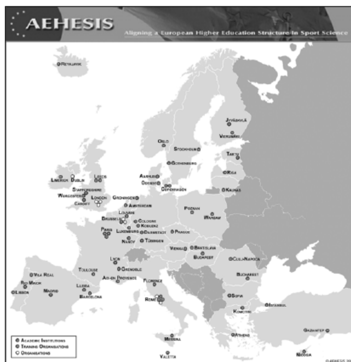
Figure 1: AEHESIS Partner Organisations