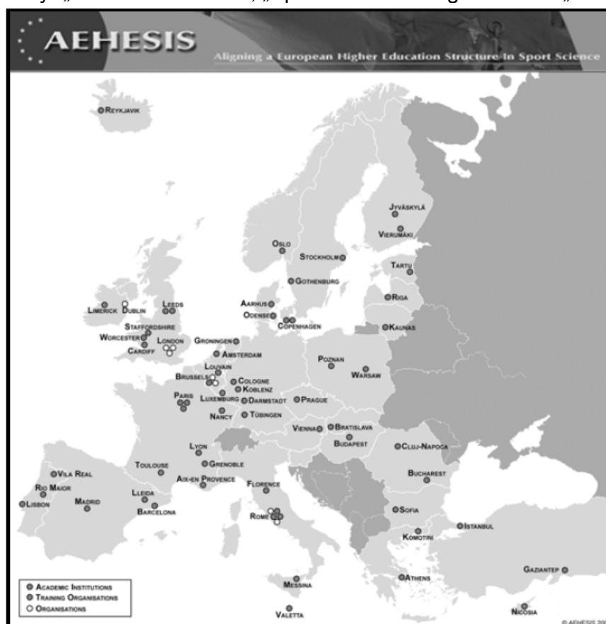
Obrázek 1: Partnerské Organizace v projektu AEHESIS

Projekt AEHESIS byl z pověření Evropské Sítě Sportovních Věd, Výchovy a Zaměstnanosti (ENSSEE) koordinován Institutem rozvoje sportu v Evropě a volnočasových studií na Německé Sportovní Universitě v Kölnu. Projekt byl řízen manažerskou skupinou, týmem expertů a čtyřmi výzkumnými týmy. Cílem bylo identifikovat a implementovat klíčové oblasti sportovní výchovy, zejména v sektorech: „Tělesné výchovy“ „Zdraví a zdatnosti“, „Sportovního managementu“ a „Trenérství“.